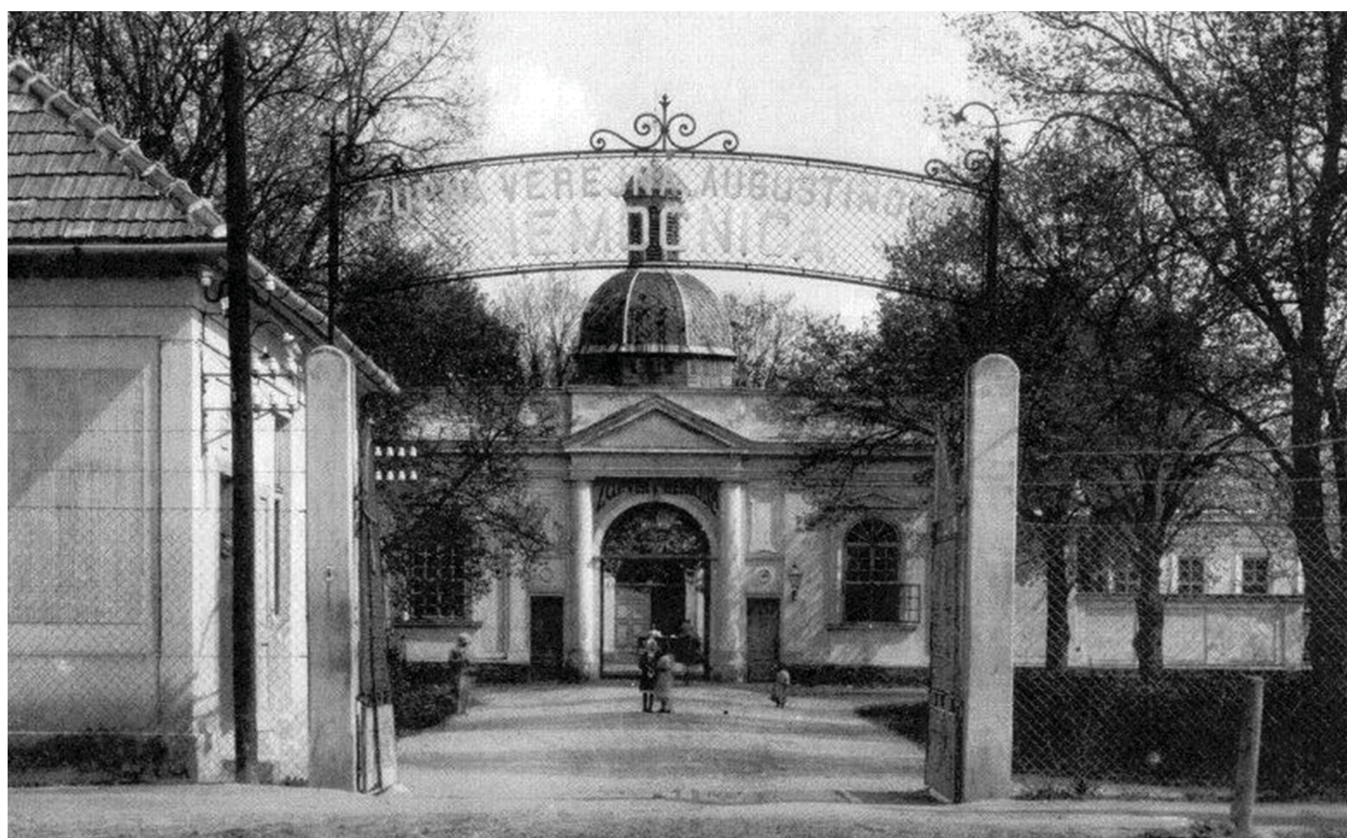
VSTUP DO NEMOCNICE V ROKU 1916.

V roku 1904 sa začalo, s výstavbou nového pavilónu pre infekčné ochorenia (boli v ňom dve menšie trojposteľové a dve päťposteľové izby). Do užívania bol odovzdaný v roku 1905.