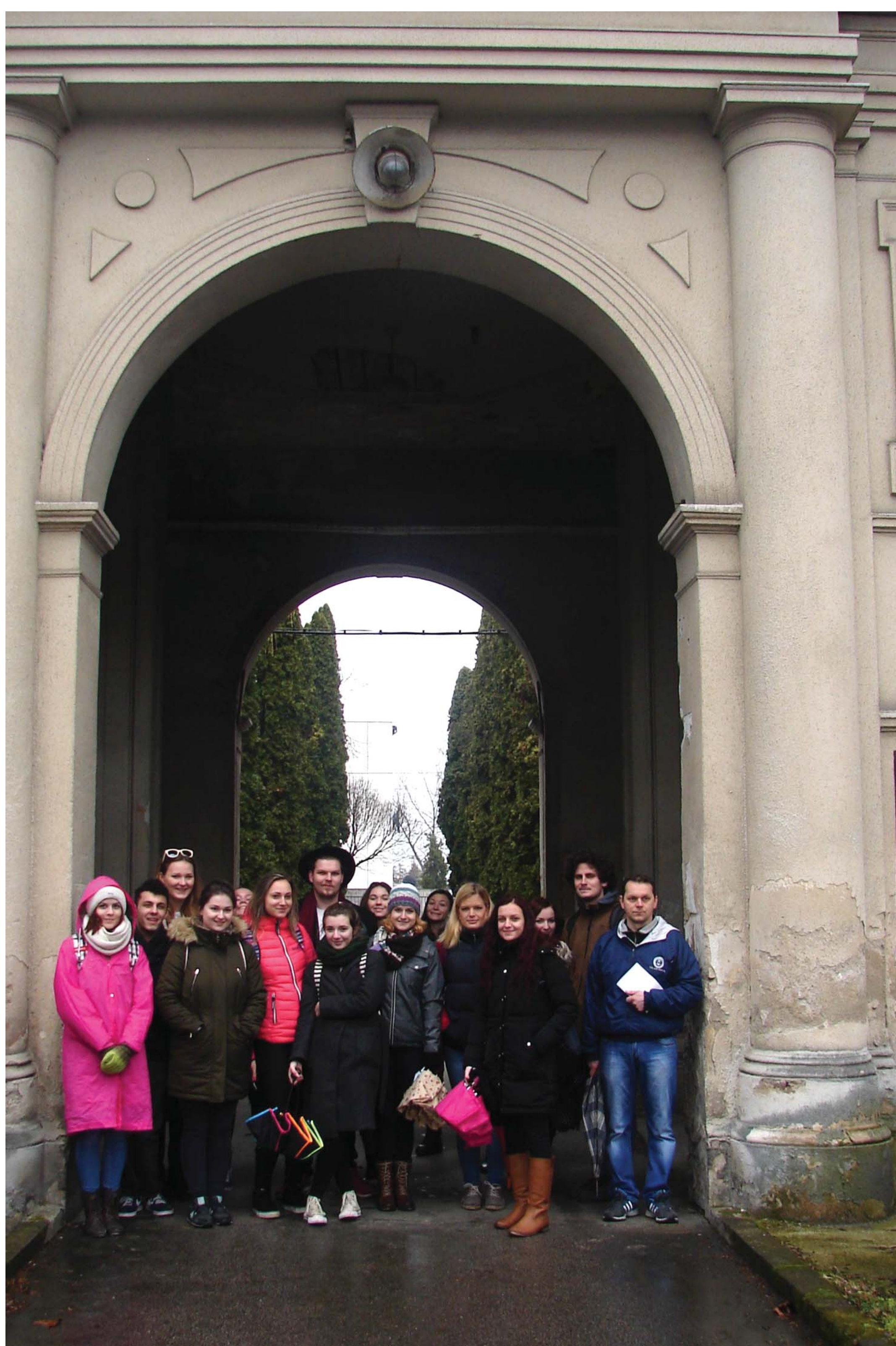
NA PROJEKTE SPOLUPRACUJÚ I ŠTUDENTI JEDNOTLIVÝCH FAKÚLT

2018 EURÓPSKY ROK KULTÚRNEHO DEDIČSTVA #EuropeForCulture