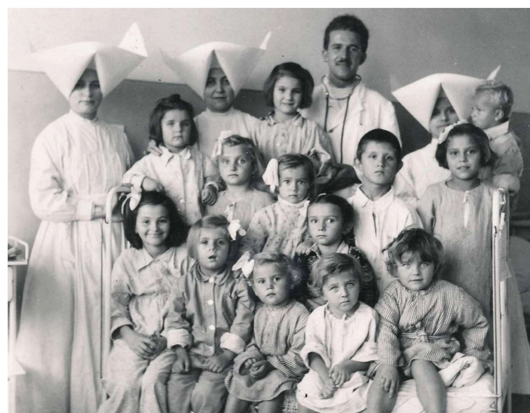
REHOĽNÉ SESTRY VINCENTKY A DETSKÍ PACIENTI.

2018 EURÓPSKY ROK KULTÚRNEHO DEDIČTVA #EuropeForCulture